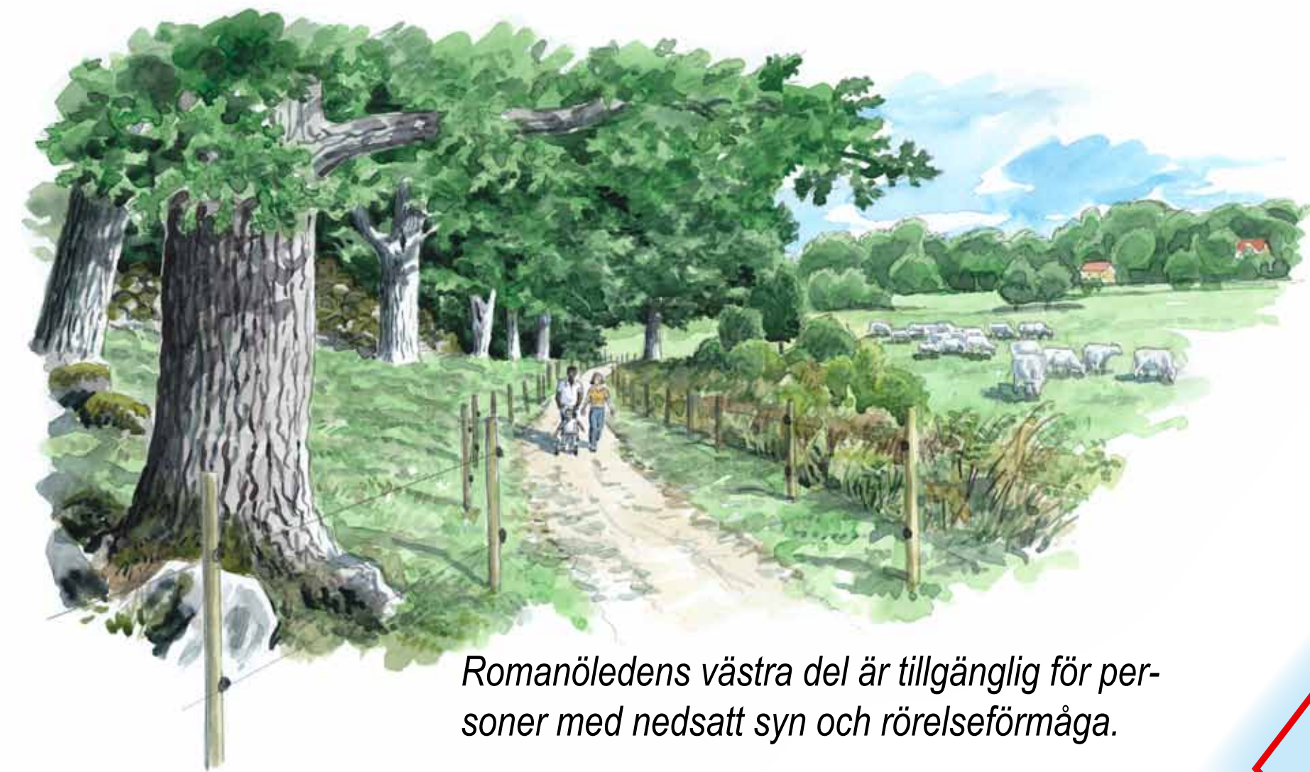
Romanöledens västra del är tillgänglig för personer med nedsatt syn och rörelseförmåga.

Gamla ekar och lindar sätter sin prägel på det gamla odlingslandskapet ute på udden. Den äldsta eken är uppemot 300 år. På de grova trädens fårade bark växer sällsynta lavar och svampar.