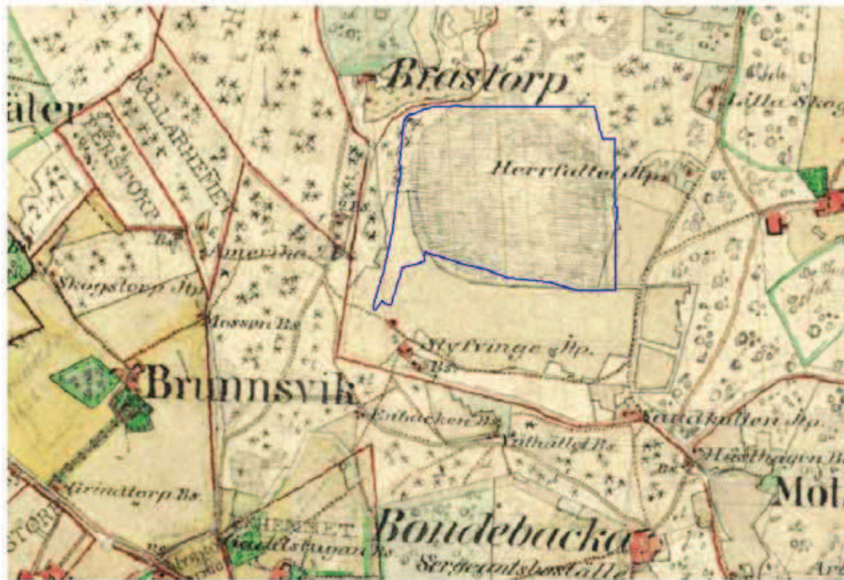
Häradskarta över området.

Området omfattas av detaljplan (sp 247) där mossen anges som park eller plantering. I detaljplanen beskrivs att skogskaraktären och dammen bör bevaras.