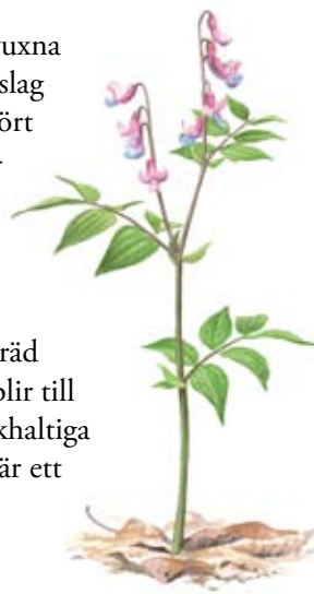
Vårärt ( Lathyrus vernus ) växer i lövskogen.

I södra delen av reservatet växer en drygt hundra år gammal lövsumpskog. Här står döda träd kvar som högstubbar eller faller till marken och blir till s.k. lågor. Gamla lövträd i kombination med kalkhaltiga källor är en mycket ovanlig och värdefull miljö där ett stort antal sällsynta mossor, lavar, skalbaggar och snäckor lever. I Sjöö-Knäppans sumpskog finns sällsynta arter med fantasieggande namn som fetbålmossa, grå vårtlav och blåoxe.