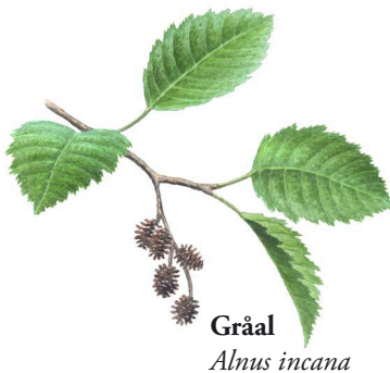
Gråal Alnus incana

I gamla och döda träd bildas också håligheter där fåglar och däggdjur kan bo eller söka skydd. Kattuggla är en av reservatets många invånare som reder sitt bo i ihåliga träd.