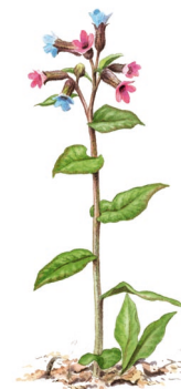
Lungört Pulmonaria obscura

Das Naturschutzgebiet hat auch eine alte und interessante Kulturgeschichte. Südwestlich des Parkplatzes liegt eine dreieckige Steininformation, die eine Begräbnisstelle aus der älteren Eisenzeit markiert. Im Gebiet findet man auch zahlreiche Steinhügelgräber, ältere Fundamente und Überreste eines Kalkofens.