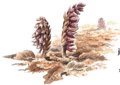
Vätteros Lathraea squamaria trivs på reservatets mullrika jordar. Vätterosen saknar klorofyll och lever ofta som rotparasit på hassel.

Terrängen i reservatet är kuperad och ett verk av den senaste inlandsisen. Geologerna kallar den här