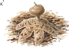
Jordstjärna Geastrum sp.

På barmattor under äldre granar kan man hitta den vackra arten fyrflikig jordstjärna. Andra rariteter i området är slöjroksvamp och blå lökspindelskivling. En riktig skönhet är skarp dropptaggsvamp, som smyckas av rödaktiga droppar.