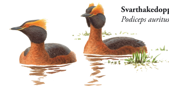
Svarthakedopping Podiceps auritus

Tack vare den omväxlande naturen är fågellivet rikt med ett 50-tal häckande arter. I Mellansjön häckar svart-hakedopping och rörhöna. Törnskata, gräshoppsångare, kärrsångare och gärdsmyg är andra arter som man kan träffa på i reservatet. Hackspettarna spillkråka och grön-göling häckar också inom området liksom kattuggla.