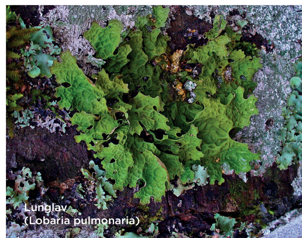
Lunglav ( Lobaria pulmonaria )