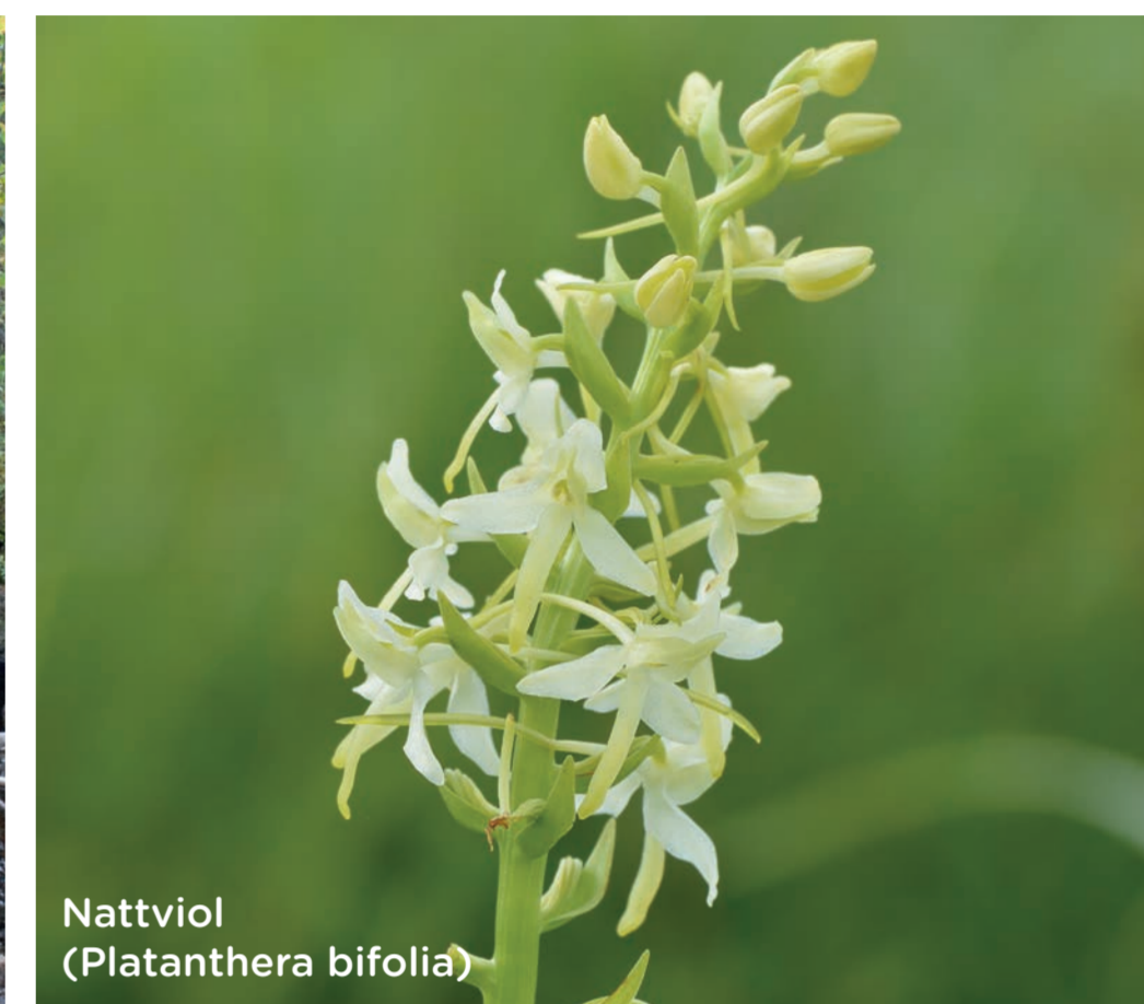
Nattviol ( Platanthera bifolia )