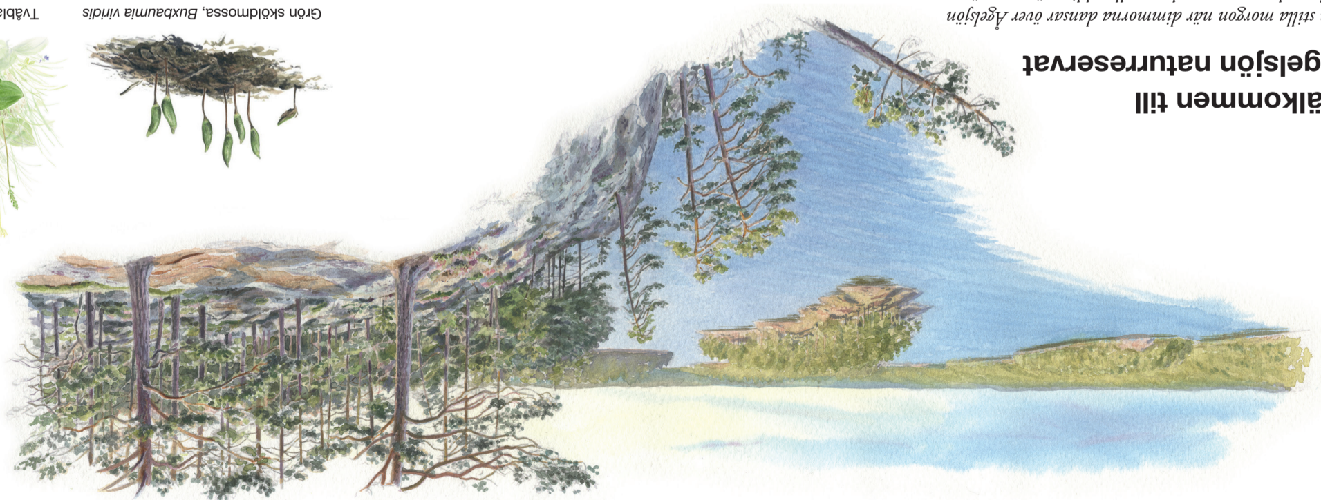
Grön sköldmossa, Buxbaumia viridis Tvåblad, Neottia ovata

Isen drar sig tillbaka För ungefär 10 500 år sedan började den senaste inlandsisen dra sig tillbaka. Då hade den legat 10 kilometer från Ågelsjön. När isen försvann var Ågelsjön en havsvik och bara toppen på Jakobsdalsberget stack upp som ett exponerat skär ovanför havsytan. Successivt höjdes marken när isens enorma tryck lätade. Vågornas kraft spolade rent klippor och skär. Sediment sjönk till botten, särskilt längs sydvästra sidan av sjön. Det är dessa sediment, tillsammans med bergsklackar, som kom att damma Ågelsjön när marken höjdes och havet drog sig tillbaka.