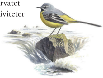
Forsärla, Motacilla cinerea

Ågelsjön är ett av de mest välbesökta naturreservaten i närheten av Norrköping. Här kan man vandra, paddla kanot, bada eller klättra. Branterna längs Ågelsjön är välbekanta hos klättrare över hela landet. För den som vill fiska finns bland annat gädda, abborre och lake i sjön men glöm inte att köpa fiskekort. Det finns flera markerade leder i reservatet. Vid Tallholmen ligger ett vindskydd och längs lederna finns grillplatser. Som besökare gäller det att vara försiktig med elden, släcka efter sig och bara elda på anordnade platser. Det finns även en tillgänglighetsanpassad slinga och vid badplatsen finns en badramp. Naturreservatet inbjuder till många olika aktiviteter och upptäckter men du behöver egentligen inte göra så mycket. Det räcker att ta en promenad och njuta av Ågelsjöns natur.