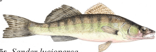
Gös, Sander lucioperca

Vandra, bada, fiska, cykla eller paddla kanot. I området finns mycket att välja på. Flera lägerplatser finns i området där du kan stanna till och grilla korv. Vill du ha en gös på kroken måste du först fixa ett fiskekort. Kolla i så fall upp Fegens fiskevårdsområdesförening. För mer info om lägerkuponger m.m. se visitfegen.se För dig som använder båt, tänk på att fågellivet är känsligt och att det därför finns hastighetsbegränsning på 5 knop. Hela sjön är Natura 2000 - ett nätverk inom EU med skyddade områden.