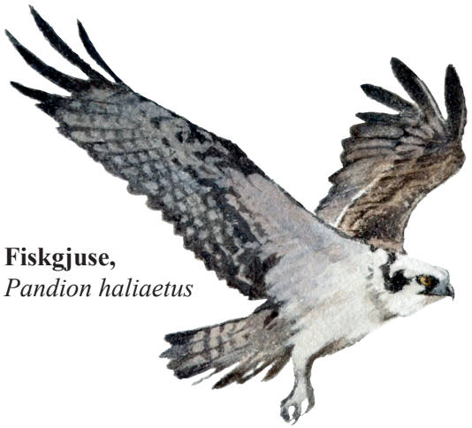
Fiskgjuse, Pandion haliaetus