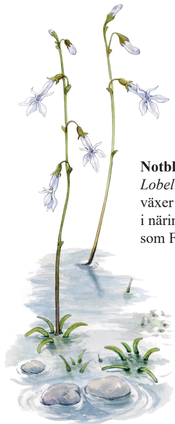
Notblomster, Lobelia dortmanna, växer i grunt vatten i näringsfattiga sjöar som Fegen.