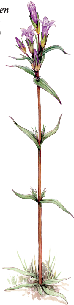
Sumpgentiana , Gentianella uliginosa , växer på strandängen vid Grosshamn