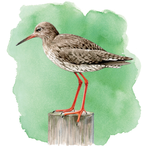
På stranden vid Haby bukt kan du få syn på Rödbenan , Tringa totanus

På torrare partier i kanten mot bergknallarna i området finner olika lök- och fetbladsväxter fäste för sina rötter. Här kan backlök och sandlök stå sida vid sida, den förra med två oliklånga spretiga hölsterblad, den senare med ett enda trubbigt. Den mycket vanliga kärleksörten växer i bergskrevor och på hållmarker. Engelsk fetknopp, som av lokalbefolkningen helst kallas bohusfetknopp, växer på sina ställen i stora mattor i området. Den är vitblommig ofta med en blekrosa ton och blommar ungefär samtidigt som gul fetknopp men tidigare än vit fetknopp.