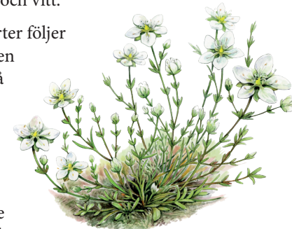
Knutnarv Sagina nodosa

En hel rad andra arter följer och mitt i sommaren kan kustrutans små blommor som saknar kronblad studeras. Växten har istället många, långa och väl synliga ståndare och ett sirligt gracilt bladverk.