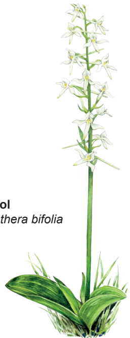
Nattviol Platanthera bifolia