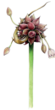
Backlök Allium oleraceum

Nordväst om parkeringsplatsen vid Haby bukt ligger en dalgång omgiven av branta bergssidor som sträcker sig in mot Soteskogsmynnen. Hällingedalen och myren har en rik och varierad flora med granspira, låsbräken samt orkidéerna jungfru Marie nycklar, nattviol och korallrot. Vid Soteskogsmynnen finns torpgrunder och stengårdsgårdar som vittnar om äldre tiders jordbruk. Här blommar gullvivor om våren och vid myren växer vippstarr.