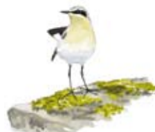
Stenskv tta Oenanthe oenanthe