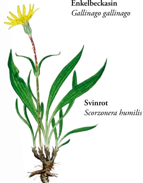
Svinrot Scorzonera humilis