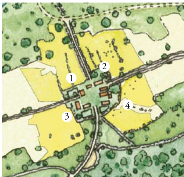
Äskhults by och de fyra g rdarna: 1. Derras, 2. J nsas, 3. Bengts och 4. G ttas. I de restaurerade  kerarna n rmast g rdarna har stenr sen och stenstr ngar  terskapats.

Äskhult är ett av de större besöksmålen i Halland och här bedrivs en omfattande publik verksamhet. Temavandringar, midsommarfirande, barnens dag, skördefest, berättarcaf , julmarknad och mer d rtill ing r i den omfattande programverksamheten. F r skolklasser finns ett speciellt program med teman som varierar mellan byns historia, landskapsutveckling, prova-p -sl jd samt folktro med skrock och s gner. Dagliga guidningar genomf rs under sommarhalv- ret, d  ocks  kaf et i Bengts manhus h lls  ppet.