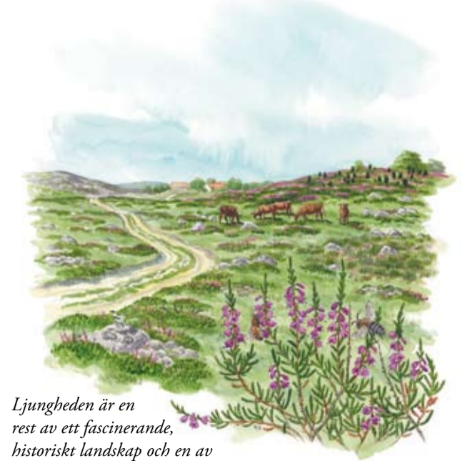
Ljungheden  r en rest av ett fascinerande, historiskt landskap och en av Europas mest hotade naturtyper.

En stor del av skogen har under senare  r avverkats f r att ge plats  t en  ppen ljunghed. Ljungheden betas p  nytt och i maj 2006 genomf rdes den f rsta ljunghedbr nningen i modern tid i  skhult. Ljunghedbr nning  r en gammal metod som traditionellt sett har anv nts f r att f ryngra ljungheden och f rb ttra betet.