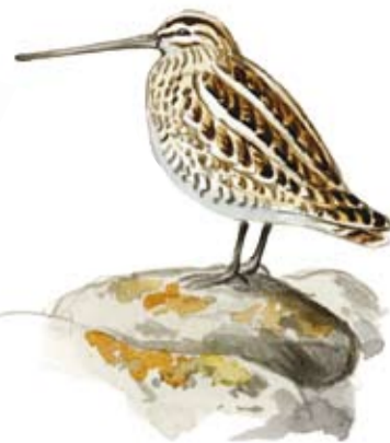
Enkelbeckasin Gallinago gallinago