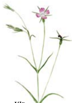
Kl tt Agrostemma githago

I  skhult odlas  ldre lant-sorter av r g, havre, korn och lin men vissa  krar ligger i tr da f r att f  bukt med  kertistel.  krarna pl js och sk rdas med hj lp av h st och l tta redskap. P   krarna blommar under sommaren kl tt, bl klint och  kerkl tt – gamla  kerogr s som helt f rsvunnit eller  r mycket ovanliga i det moderna jordbrukslandskapet.