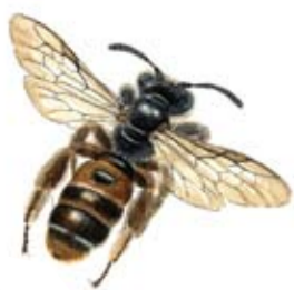
Väddsandbi Andrena hattorfiana