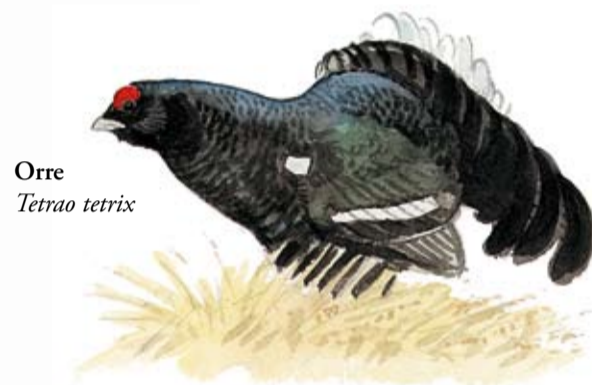
Orre Tetrao tetrix