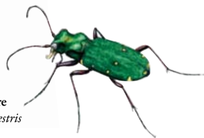
Grön sandjägare Cicindela campestris