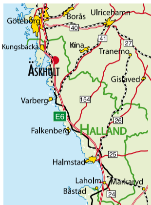
Fr n E6, tag av vid Fj r savfarten. F lj skyltad v g till  skhult via G llinge, totalt ca 1,4 mil.

  Text och form: Naturcentrum AB, Stenungsund; 1:a uppl. 2008, 2:a uppl. 2010. Illustrerad karta: Carina Lindqvist. Illustrationer: M. Holmer (orre) & N. Forshed ( vr.). Omslagsfoto: Bergslagsbild AB.