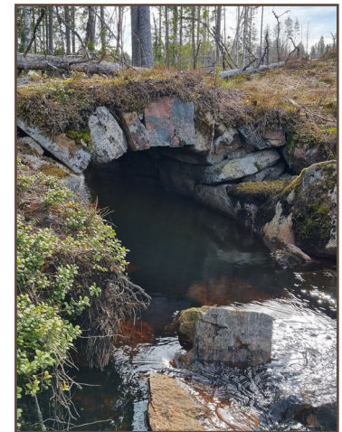
Stenbro vid Fågeltjärnet.