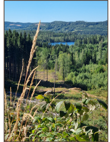
Utsikt nordväst om Röstorp.

Från korsningen i Tobyn går du västerut längs byvägen. Här kan det komma lokal trafik. Vid y-korsningen håller du vänster och når fram till parkeringen vid Storperstorpet.