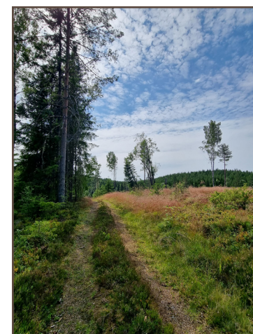
Kärrväg söderut mot Tobyn.