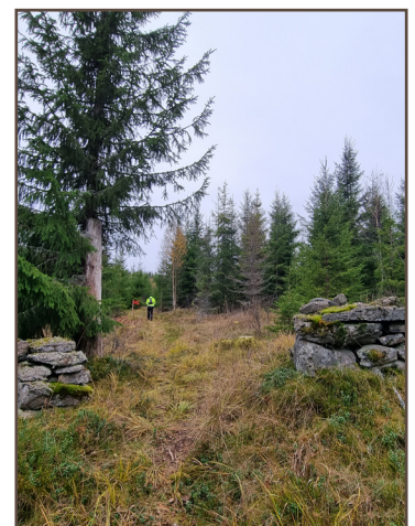
Torplämning vid Fågelkullen, 100 m norr om leden.