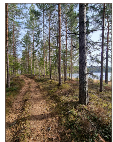
Mysig barrstig intill Fågeltjärnet.