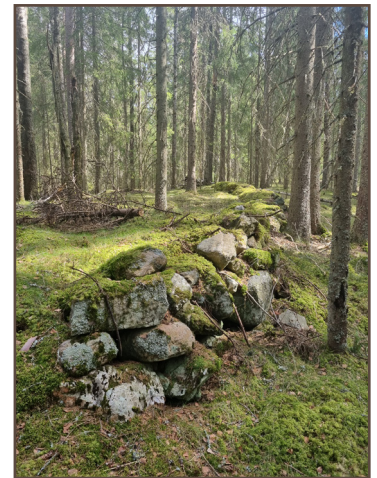
Stenmur söder om Porna.