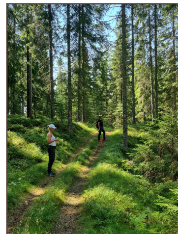
Kärrväg söderut mot Tobyn.