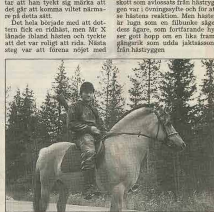
PÅ HÄSTRYGGEN. Det är inte varje dag man möter en jägare till häst i hälsingeskogarna.

Någon större framgång har denna jägare hittills inte haft med sitt sätt att jaga. De enda skott som avlossats från hästryggen var i övningsyfte och för att se hästens reaktion. Men hästen är lugn som en filbunke säger dess ägare, som fortfarande hyllar gott hopp om en lika framgångsrik som udda jaktssång från hästryggen.