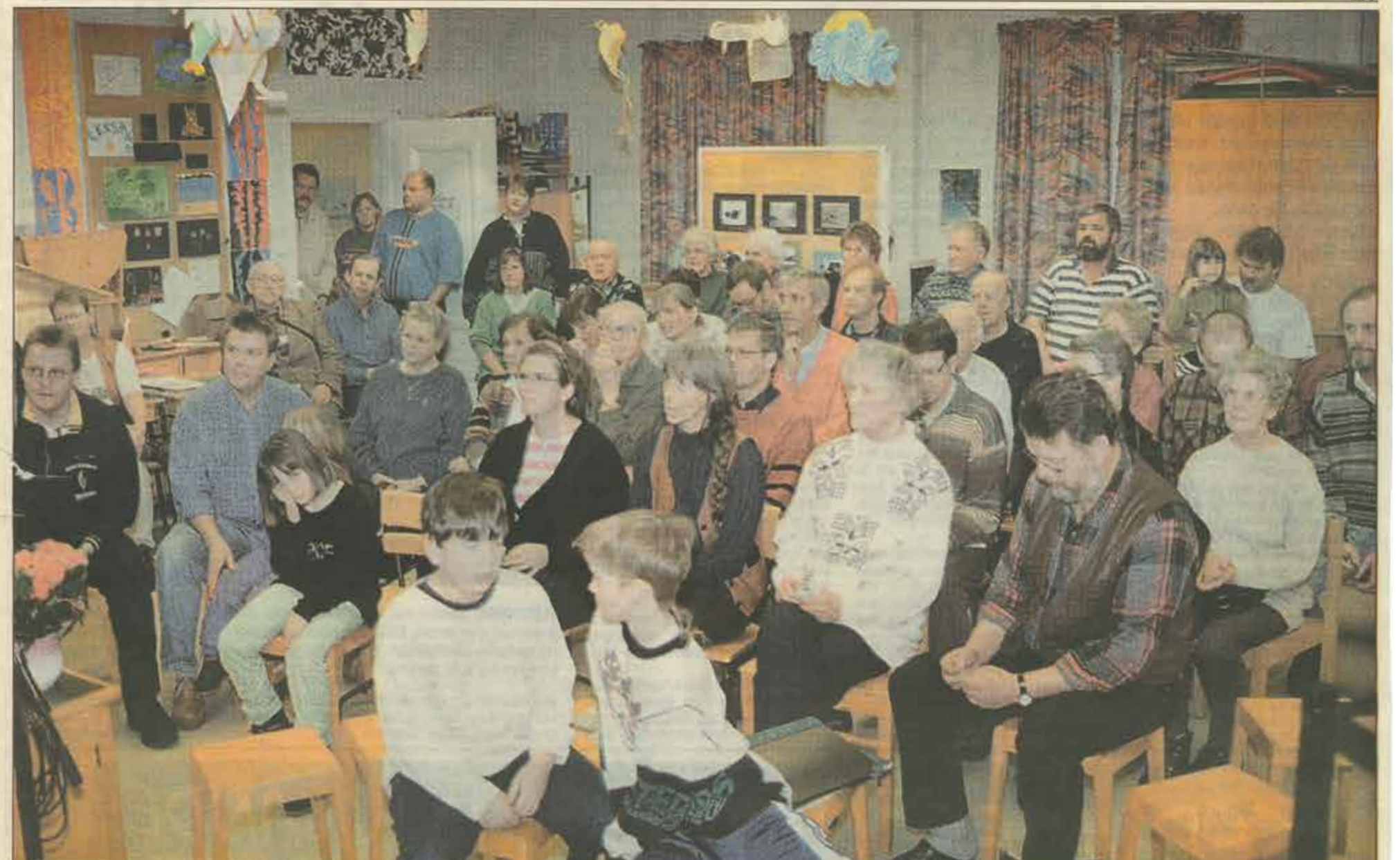
FULLSPIKAT. Skolan först, bygdegården sedan. Det är den turordning bygdeföreningen tänker arbeta efter. Samtidigt ligger flera aktuella projekt och väntar, projekt som kan bli verklighet mycket snabbt och med enkla medel.