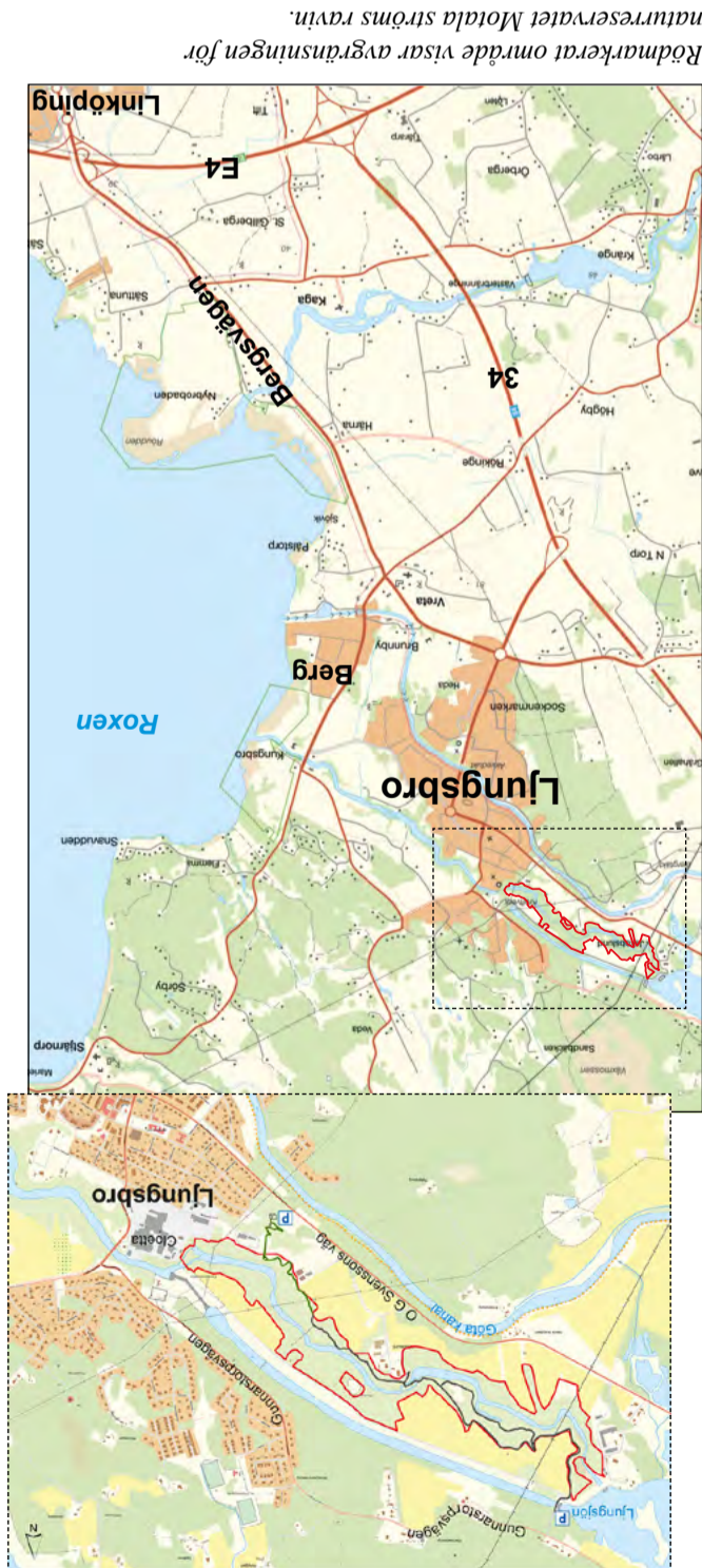
Rödmarkerat område visar avgränsningen för naturreservatet Motala ströms ravin.