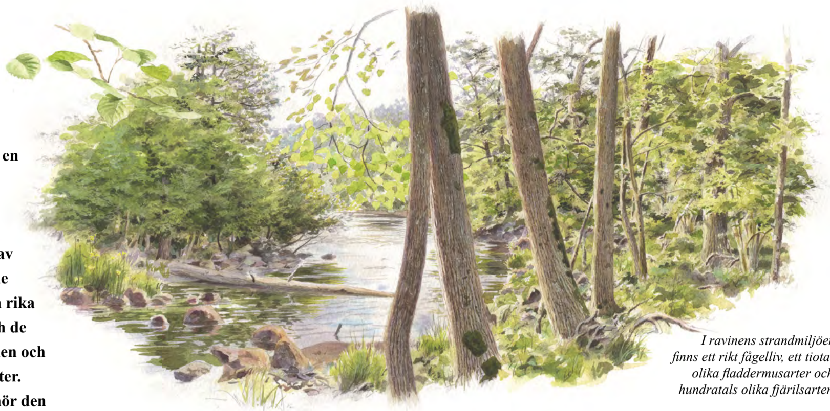
I ravinens strandmiljöer finns ett rikt fågelliv, ett tiotal olika fladdermusarter och hundratals olika fjärilsarter.

Vegetationen består av lövskog med stort inslag av gamla grova träd. Mest utmärkande är gamla grova ekar och lindar på norrsidan av ravinbotten och gamla grova och ihåliga aspar spridda i hela området. Närmast vattnet dominerar klibbal och hägg och på lite torrare mark finns mycket hassel. I området finns en hel del örter som hör lövskog till.