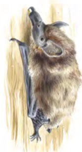
Nordfladdermus. En av det tiotal olika fladdermusarter som förekommer i naturreservatet.