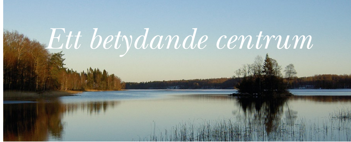
Holmen "Lilla Amerika".

till belysning i många hem, men bara på dag- och kvällstid. På natten stängdes eldistributionen av.