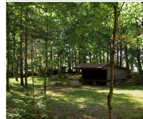
Vindskyddet på Nässja udde.

Sätessgård. En sätessgård var ursprungligen en lantegendom som ägdes och beboddes av en adelsman. Sätessgården var befriad från att betala skatt. Såväl byggnad som jordbruket skulle underhållas ordentligt för att skattefriheten inte skulle äventyras. Ordet "säteri" har samma innebörd som sätessgård.