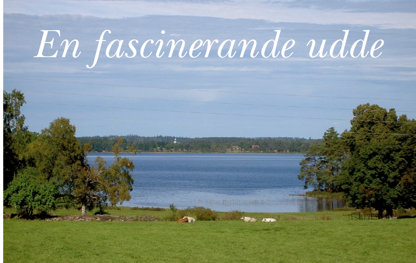
Landskapet bjuder på vackra öppna vyer. Här utsikt mot norr med Unnaryds kyrka.

Från den sydligaste udden på Nässja kan man ana gården Sjö på andra sidan. En urgröpt hålväg på backkrönet upp mot Nässja talar sitt tydliga språk. Många vagnar har genom tiderna gått av och an mellan sjöstranden där nere och gården där uppe. I synnerhet i tjällossningen när marken var mjuk gröpte sig kärrans hjul och oxarnas klövar djupt ner i vägen.