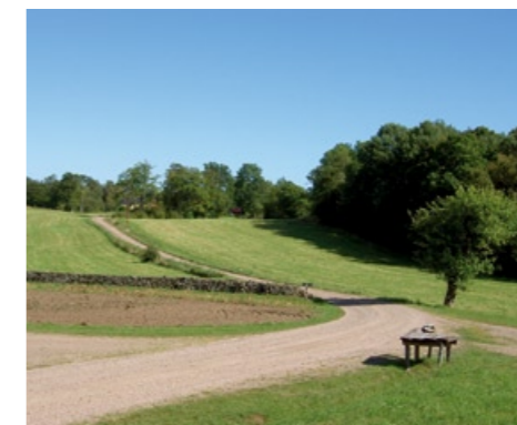
Mjölkbord som förr.