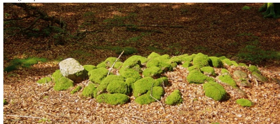
Odlingröse på Norrnäs udde.

på Norrnäs. Här fanns nu två sätesstu- gor. Den ena beskrevs som "onödig och utsynes". De övriga husen beskrevs som odugliga och förruttna. Någon trädgård fanns inte mer än en "allenast nödig Kåhlgård".