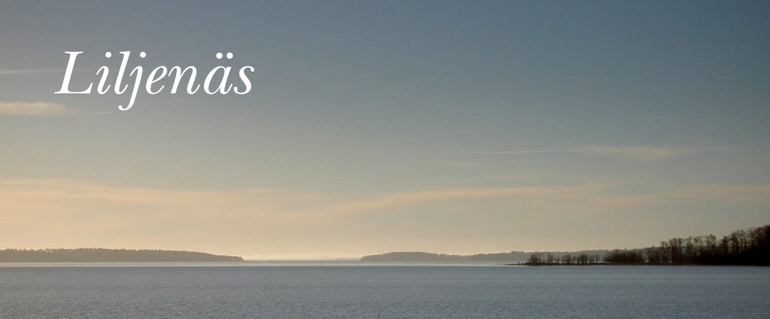
Kvällsstämning över Liljenäsviken.