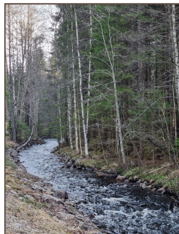
Tobyälven längs väg 878.