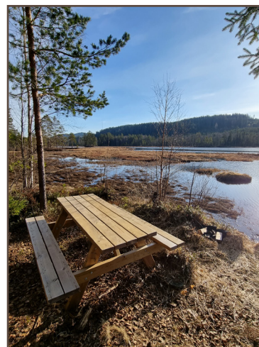
Bänkbord vid Nedre Flytjärnen längs väg 878.