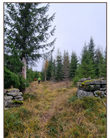
Torplämning vid Fågelkullen, 40 m norr om leden.