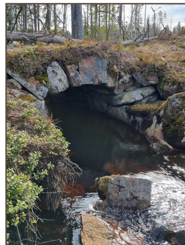
Stenbro vid Fågeltjärnet.

Mer detaljer om torplämningarna hittar du på Fornsök: https://app.raa.se/open/fornsok/