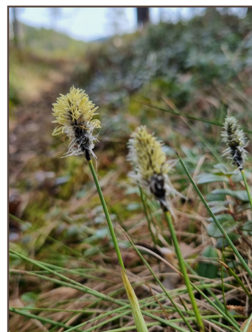
Blommande tuvull i maj.