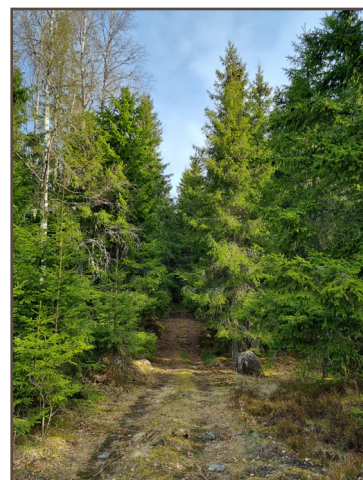
Kärrväg genom ung granskog.