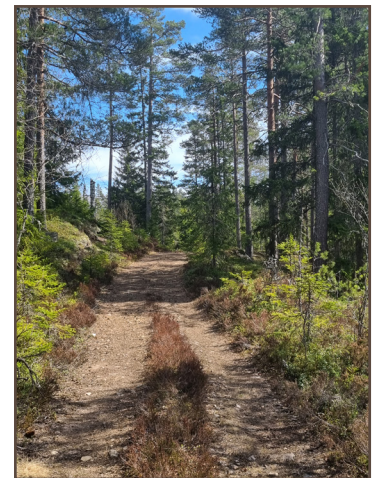
Ljung och tall längs Pornamossen.