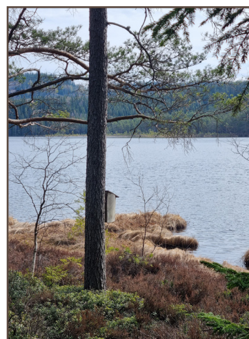
Holk vid Fågeltjärnet.