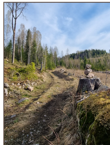
Lätt stigning över hygge, södra delen.

Här finns en rymlig parkering. För att komma till leden följer man bilvägen norrut ca 1,2 km innan man svänger in på grusvägen österut genom ett bostadsområde, där det tyvärr inte finns någon parkeringsplats. Därför hänvisar vi till hembygdsgården.