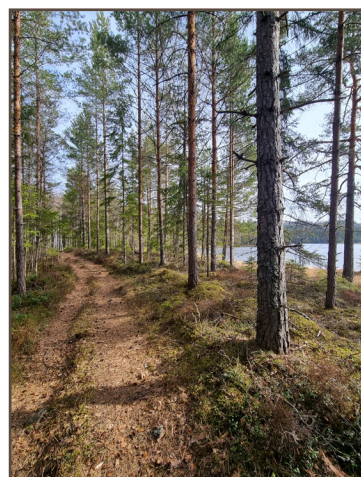
Mysig barrstig intill Fågeltjärnet.