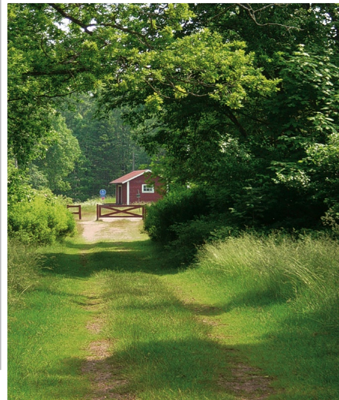
Bolmenmarschen förbi Pilsborg.

passera Pilsborg. Trots stationen och det vackra läget växte inget samhälle upp. Det gamla stationshuset står kvar än idag, med såväl namnskyld som perrong. Banvallen är nu kombinerad vandrings- och cykelled. Pilsborg ligger åter stilla.