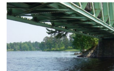
Vy av Pilsborg från brofästet.

Efter Pilsborgs fall var det förhållandevis lugnt på platsen under de nästkomman- de 450 åren. Men i slutet på 1880-talet bröts lugnet. Då byggdes järnvägen mel- lan Bolmen och Halmstad, som skulle