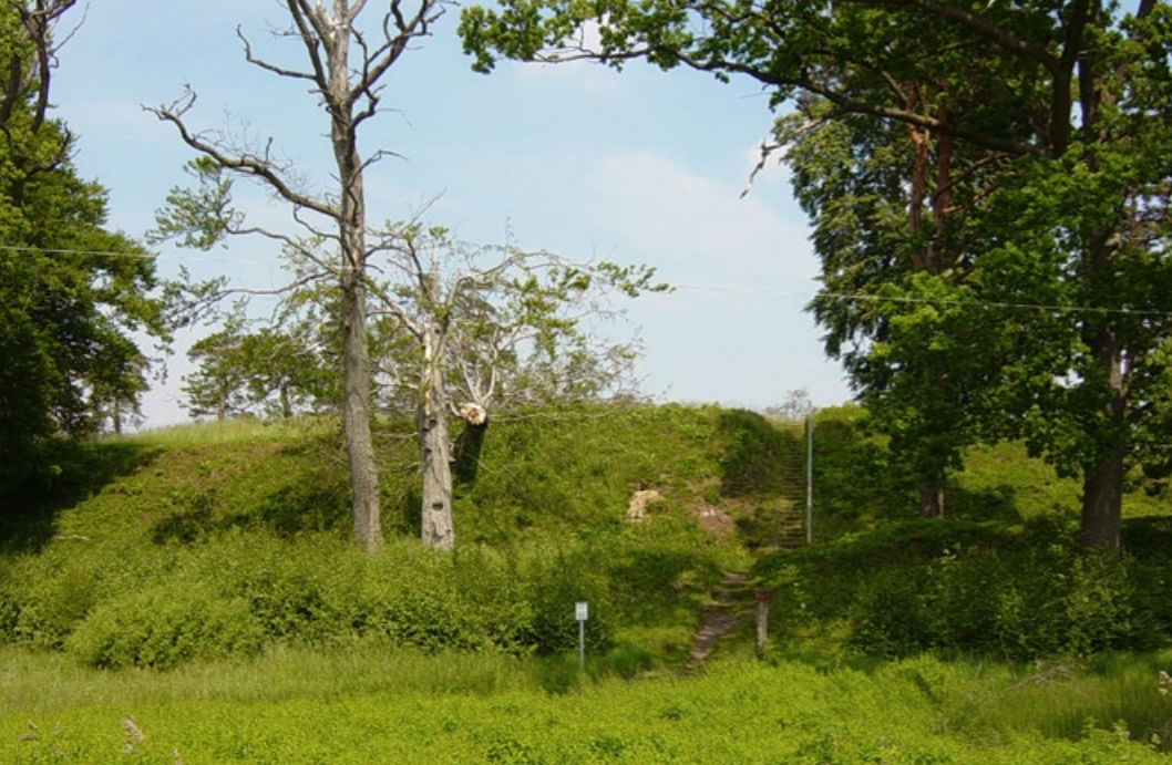
Yttervall på Pilsborg.