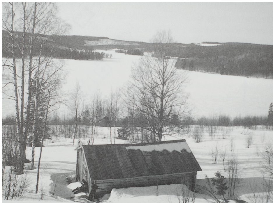
Lada nedanför Åskjansbodarnas fäbodvall, med Gålsjön i bakgrunden. Numera har den uppväxande skogen återtagit landskapsbilden.

Efter några kilometer, på höger sida mot Gålsjön, ligger Åskjansbodarna. De låg tidigare vid byn Djupdalen, men flyttades 1851 till nuvarande plats. Att en ullångersby tilldelades fäbodställe i Vibyggerå, gällde även för Knäppa och Stensland, som gemensamt hade Knäppabodarna. Åskjansbodarnas placering har tydligt präglat området, då det namngivits på kartan "Åskjansudden", och etablerade begrepp är också "Åskjalandet", "Åskjalandsvägen". Som sista år för fäboddrift uppges 1918, därefter fortsatte åkrarna en tid brukas av bonden på Sanna. Av fäbodvallens byggnader finns inget kvar, däremot en stuga med plåttak och en lada närmare Gålsjön.