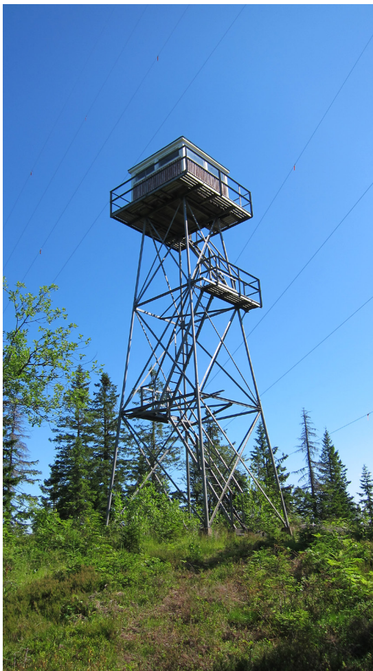
Brandtornet Undromshöjden Foto Thomas Birkö.

På toppen av Undromshöjden tronar brandtornet, byggt kring 1940 i Länsstyrelsens regi. Allt eftersom skogens värde ökat, blev behovet av brandbevakning viktigare. Under 1930-talet fanns det närmare 300 bevakningstorn runt om i Sverige.