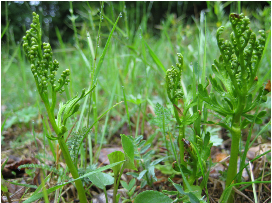
Topplåsbräken Leåhägena.

Efter Leåtorpet en bro över Leån, förtjänstfullt uppförd av skoterklubben. Därefter över Leåvägen, och in på "gammfäbovägen" mot Undromsbodarna. Vid en knapp kilometer motlut nås Leåhägena, vilket också var en utslätter till Leåtorpet. Även här hävdas marken som slätteräng. Här finns de största biologiska och botaniska värdena, med förekomst av topp- och månlsbräken.