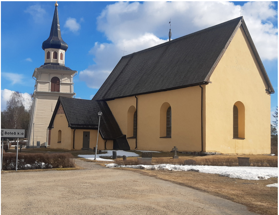
Boteå kyrka

Delar av Ådalsleden 2 (som fortsättningsvis kallas endast Ådalsleden), hade tidigare rustats upp och underhållits, dock inte i en sammanhållen enhet. Den har nu sin början vid Boteå kyrka, en av många i raden på Ångermanälvens nordöstra sida.