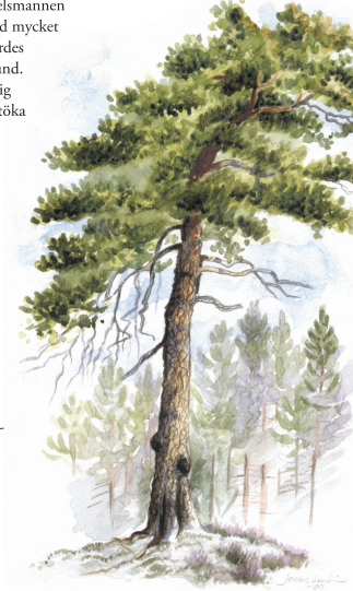
Gammal tall Pinus sylvestris

I den grovt stenkravliga stranden på sydöstra sidan står riktiga gammeltallar. Det är skruvade, 350-400-åriga bjässar, med grova grenverk och närmare tre meters omkrets, som har hackspettshäl och gnag av ovanliga skalbaggar.