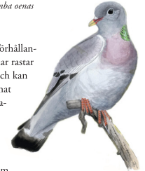
Skogsduva Columba oenas