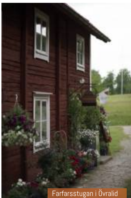
Farfarstugan i Övralid