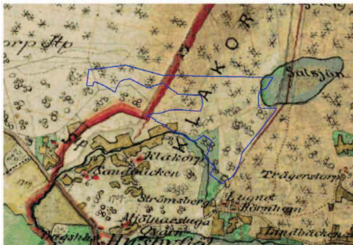
Häradskarta över området.

Enligt häradskartan över området var det i slutet av 1800-talet beväxten med barrträd. I ett område i sydost dominerade lövträden och i söder låg en löväng.