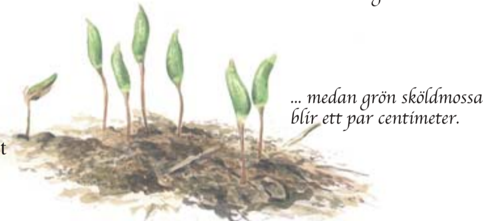
... medan grön sköldmossa blir ett par centimeter.