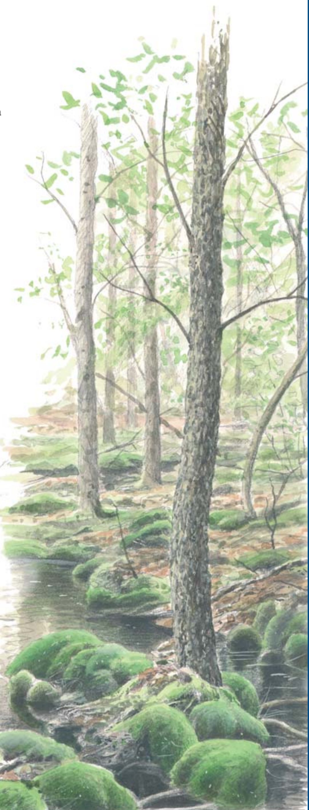
Blåmossa växer i tätta runda kuddar, på marken eller på stambaser i sumpskogarna.