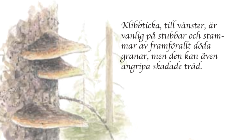
Klibbticka, till vänster, är vanlig på stubbar och stammar av framförallt döda granar, men den kan även angripa skadade träd.