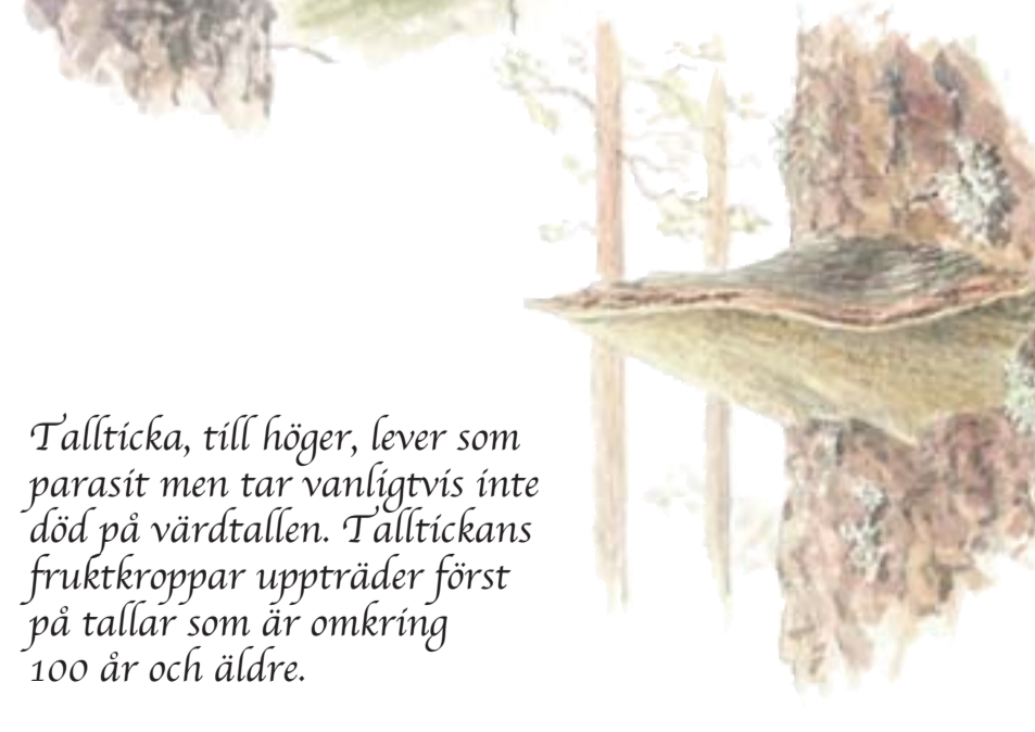
Tallticka, till höger, lever som parasit men tar vanligtvis inte död på värdtallen. Talltickans fruktkroppar uppträder först på tallar som är omkring 100 år och äldre.