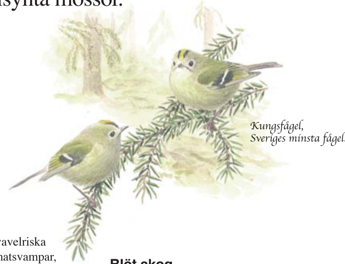
Kungsfågel, Sveriges minsta fågel.

Den svampkunnige finner kanske svavelriskor och orange taggsvamp. De är inga matsvampar, men intressanta genom att de berättar något om marken. Båda växer på kalkrik jord, kalk som inlandsisen fört med sig från slätten i norr.