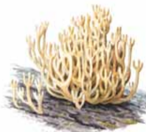
Kandelabersvamp ( Artomyces pyxidatus )