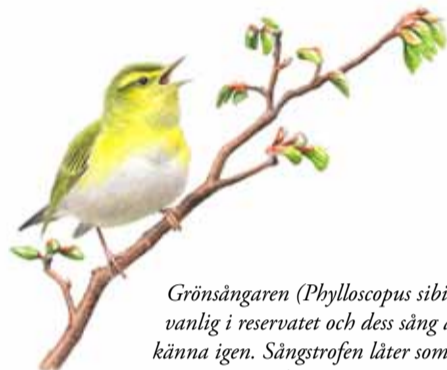
Grönsångaren ( Phylloscopus sibilatrix ) är vanlig i reservatet och dess sång är lätt att känna igen. Sångstrofen låter som ett snurrande mynt på en marmorskiwa.