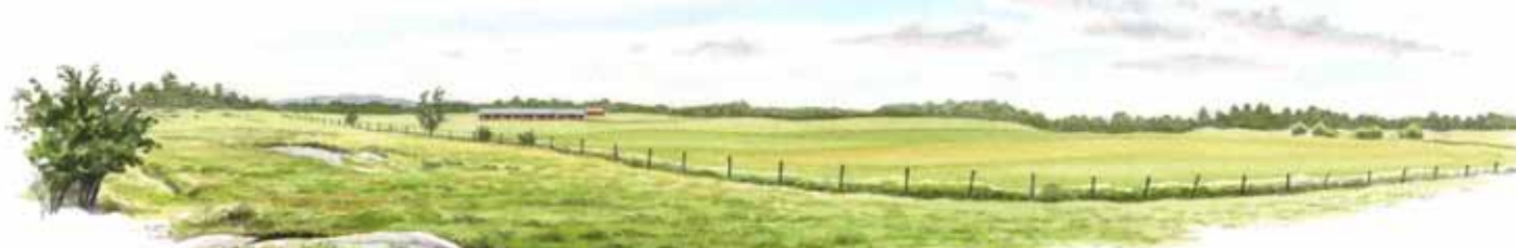
Centralt i reservatet breder ett böljande jordbrukslandskap ut sig.

Även vattennivån i sjön Järnlunden har förändrats genom åren. På 1850-talet anlades Kinda kanal varvid sjön sänktes med över 2,5 meter. Längs stranden kan man se tydliga terrasser från den tidigare strandlinjen.