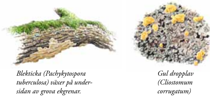
Blekticka ( Pachykytospora tuberculosa ) växer på undersidan av grova ekgrenar.

Bränd ved är livsviktig för många djur och växter.