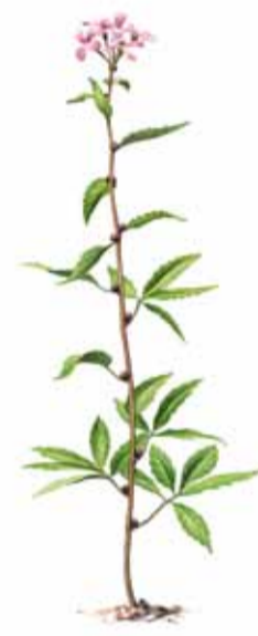
Tandrot ( Cardamine bulbifera )