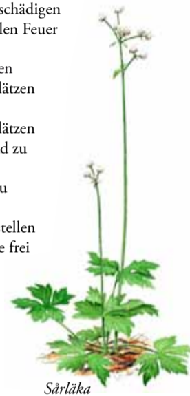
Särlåka ( Sanicula europaea )