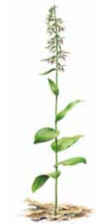
I asp-skogen intill vägen mellan Viggebysand och Jaktstugeudden växer ett stort bestånd av orkidén skogsknipprot ( Epipactis helleborine ).