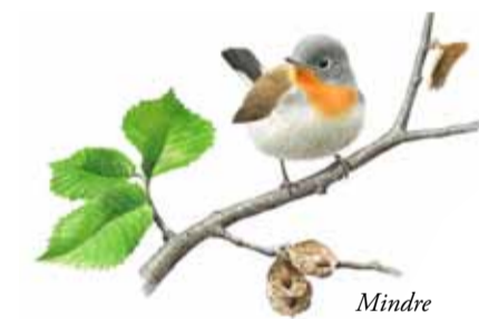
Mindre flugsnappare ( Ficedula parva )

Reservatet vilar på nästan 2 000 miljoner år gammalt urberg. Vid Viggebysand finns en utställning med stenblock från Östergötlands spännande berggrund. Jordarterna, som bildats betydligt senare, domineras av