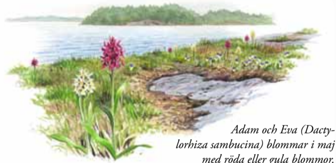
Adam och Eva ( Dactylorhiza sambucina ) blommar i maj med röda eller gula blommor.