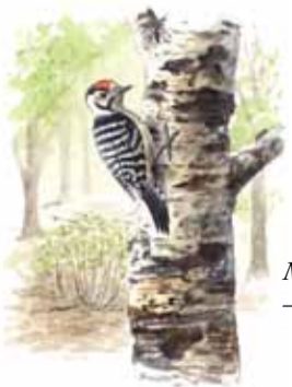
Mindre hackspett ( Dendrocopos minor ) – en karaktärsart i reservatet.