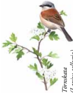
Törnskata ( Lanius collurio )

I de blomsterrika markerna lever också en mängd olika insekter. Det utnyttjas av törnskatan som fångar humlor, gräshoppor och sländor över öppna ängar och hagar.