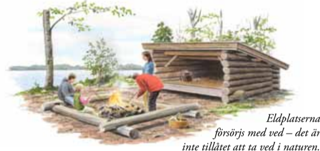
Eldplatserna försörjs med ved – det är inte tillåtet att ta ved i naturen.

I sjön Järnlunden kan man fiska gädda, abborre, gös med mera och sjön är populär bland fritidsfiskare. Aktuella fiskeregler finns på informationstavlor i reservatet och på kommunens hemsida.