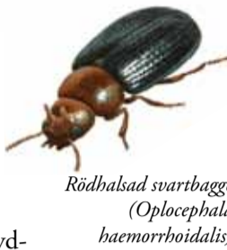
Rödhalsad svartbagge ( Oplocephala haemorrhoidalis )

Död lövved i form av högstubbar och lågor bidrar starkt till mångfalden av växter och djur. På grova, liggande aspstammar kan man om hösten se den vackra och sällsynta kandelabersvampen. Betydligt mer svårupptäckt är den rödhalsade svartbaggen, som lever i solexponerade högstubbar av björk.