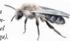
1/4 - 10/7