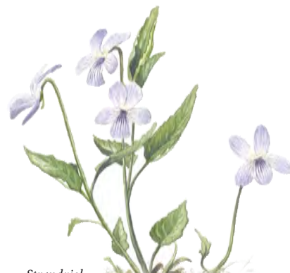
Strandviol ( Viola persicifolia )