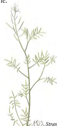
Strandbräsma ( Cardamine parviflora )

Gulärsla är en annan av strandängarnas verkliga karaktärsfåglar och dit får också räknas grågås och kanadagås som i stora flockar betar på de öppna gräsmarkerna. Gässen gynnas av att kreaturen håller vegetationen lågvuxen samtidigt som de själva bidrar till att ytterligare skärpa betestrycket.