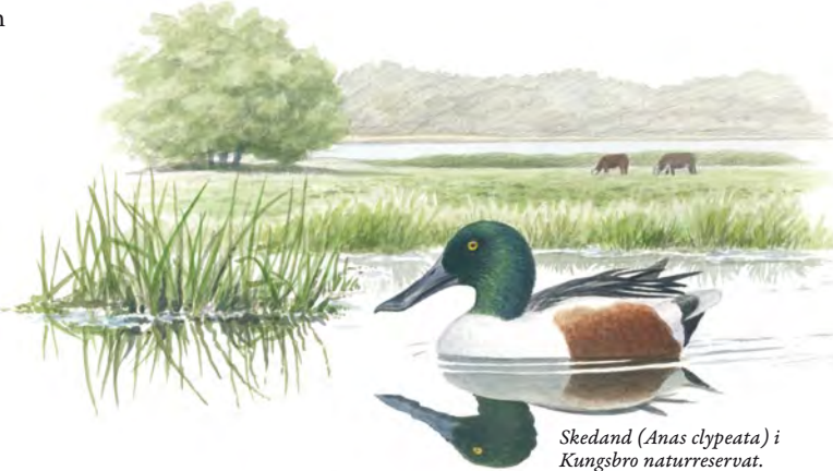
Skedand ( Anas clypeata ) i Kungsbro naturreservat.

Norra delen av reservatet ligger i slutningen upp mot skogsbygden och utgörs av en större ekhagmark. Här växer en attrik flora av typiska hagmarksväxter som ängsskallra, brudbröd, korskoll, solvända och nattviol. Många av de vidkroniga ekarna är grova med en stamdiameter över en meter. Ek barken hyser en mångfald av lavar, bland dem krävande arter som hjälmbrösklav, rosa skärelev och gul dropplav.