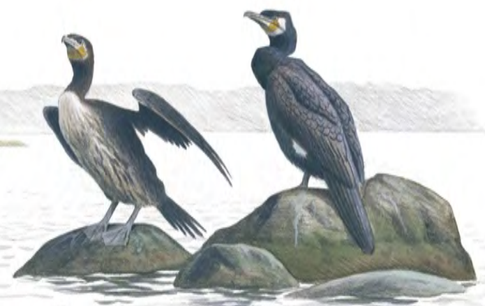
Storskarv ( Phalacrocorax carbo )