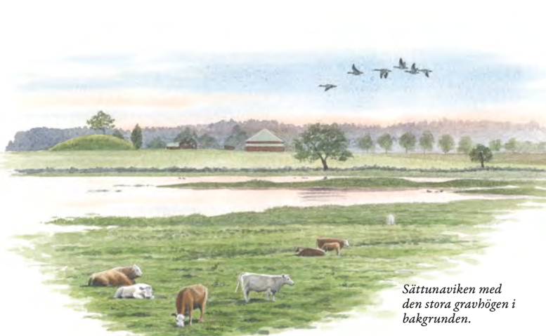
Sättunaviken med den stora gravhögen i bakgrunden.