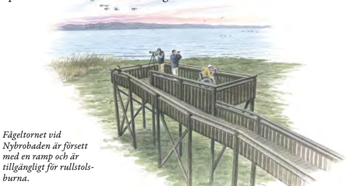
Fågeltornet vid Nybrobaden är försett med en ramp och är tillgängligt för rullstolsburna.

Besöksområdet vid Nybrobaden har anpassats för att öka tillgängligheten för rörelsehindrade. Fågeltornet har en ramp för rullstolar, barnvagnar etc. och i anslutning till tornet finns ett dass tillgängligt för rullstolsburna. Rörelsehindrade har möjlighet att parkera närmare tornet än övriga besökare.