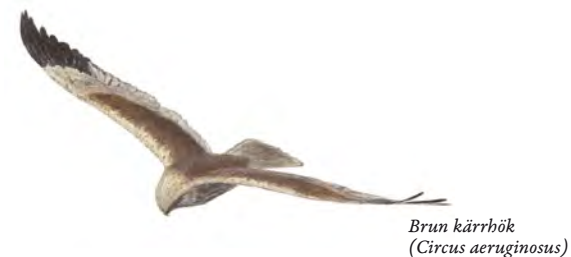
Brun kärrhök ( Circus aeruginosus )

Det kan vara svårt att hitta till Stångåns mynning och det bästa är att skaffa en stadskarta. Stångåstråket är ett välutnyttjat närströvsområde. Till fots eller med cykel går det att följa ån på nära håll hela vägen ut ur staden. Med bil kommer du inte intill ån på samma sätt, men du kan åka ut till fågeltornet vid mynningen.