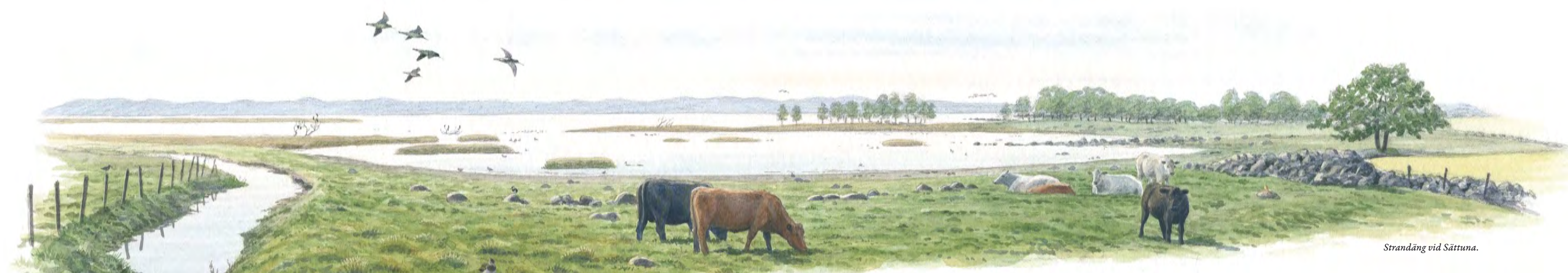
Strandäng vid Sättuna.