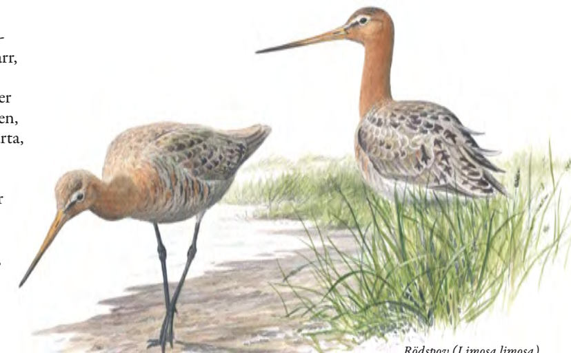
Rödspov ( Limosa limosa )

Successivt har strandängarna restaurerats och idag sker skötseln både genom slåtter och bete, vilket också gäller Kungsbro naturreservat, bildat 1996. Efter restaureringen ökade antalet häckande rödbenor, tofsvipor och gulärslor. Som kronan på verket återkom rödspoven som häckfågel vid Svartåmynningen i mitten av nittiotalet.