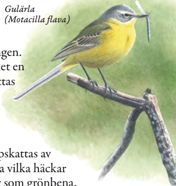
Gulärsla ( Motacilla flava )