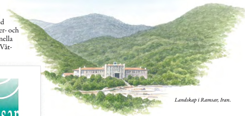
Landskap i Ramsar, Iran.

Våtmarkskonventionen var den första globala överenskommelsen om naturvård. Det är också den enda som omfattar en hel naturtyp. Nya länder har tillkommit under årens lopp och idag har cirka 150 länder anslutit sig till konventionen. Våtmarkskonventionen har ett kansli i Schweiz och vart tredje år hålls ett möte för alla deltagande länder och organisationer.