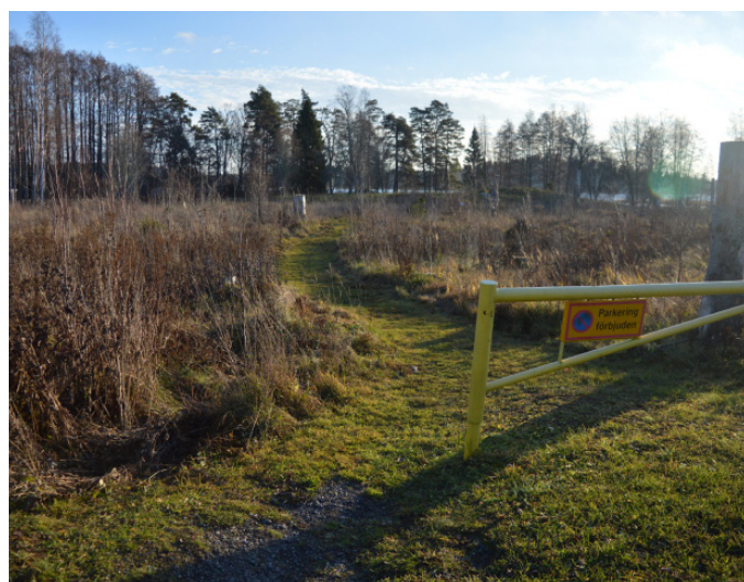
Vägbom på vägen mot badplatsen