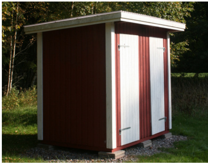
Torrtoaletterna nära badet