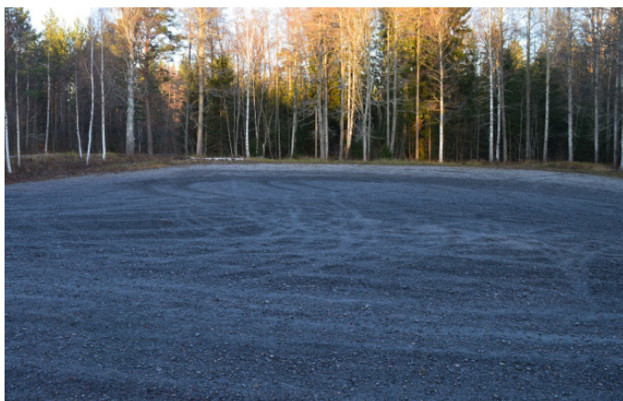
Andra delen av parkeringen vid östra badet

Stor parkering med plats för 10 bilar. Underlaget är jämt och på hårdpackat grus. Vid parkeringen finns det informationsskylt med karta över området. Från parkeringen passerar du förbi en vägbom för att komma till badet.