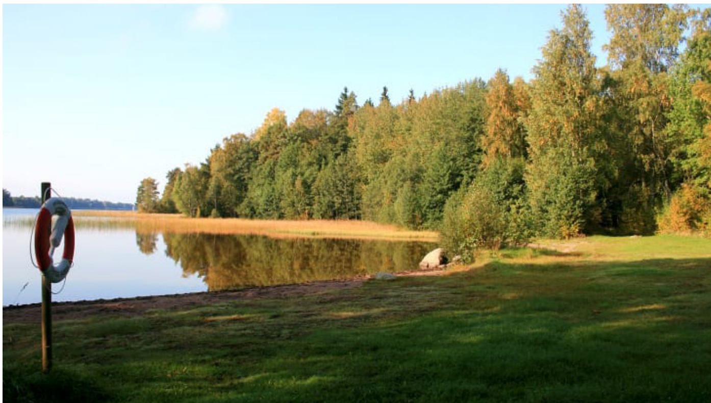
1. Östra badet