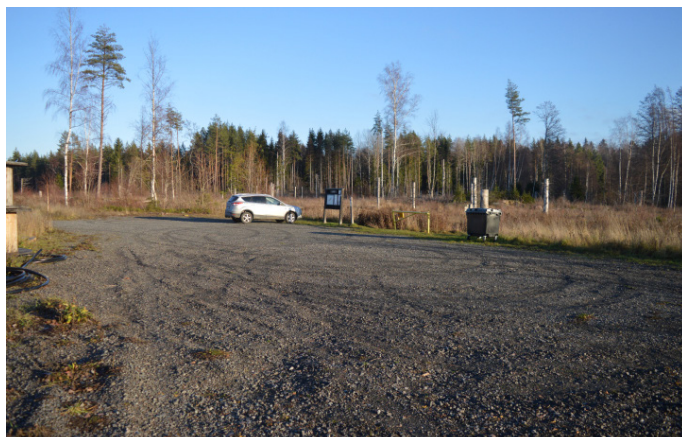
Parkeringen vid västra badet

Det finns ingen busshållplats vid Aspbo. Närmaste hållplats är 3 km bort, i Österbybruk. Från Österbybruk kan du vandra Upplandsleden fram till Aspbadet.