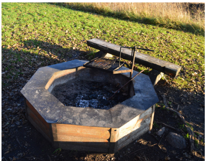
Grillen med vridbart galler