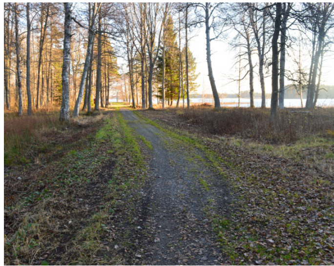
Bred stig mot badplatsen