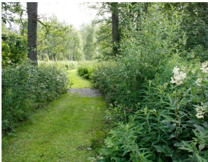
Bred stig till badplatsen

Från parkeringen följer du den klippta grässtigen mot vattnet. En vägvisare leder dig åt höger vid ett vägshål. Tar du istället åt vänster hittar du till torrtoaletterna. Badplatsen ligger totalt 150 m från parkeringen.