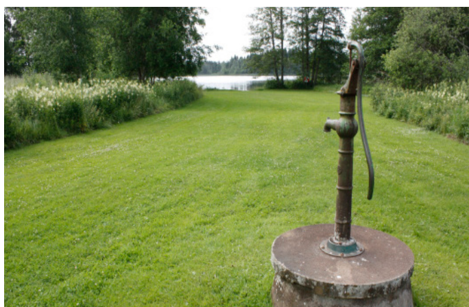
2. Västra badet