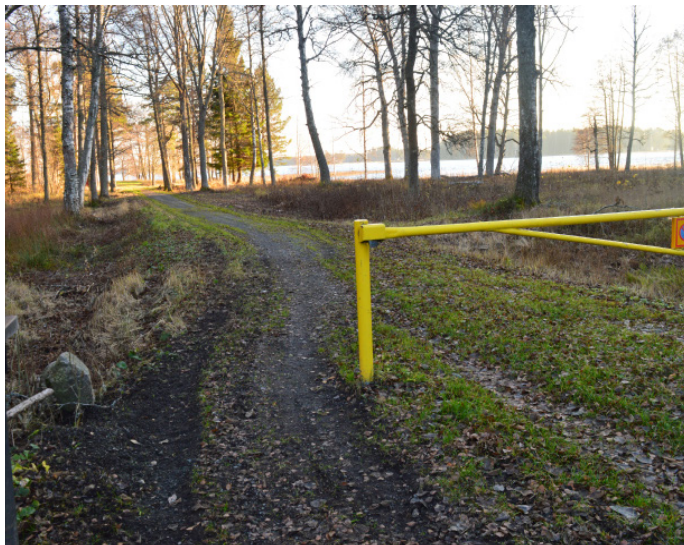
Vägbom på vägen till badplatsen

Längst ner på parkeringen vid informationsskylten passerar du förbi en vägbom. Det går bra att passera bredvid bommen med rullstol. Stigen mot badplatsen är bred och jämn. Efter 100 m ligger badplatsen till höger.