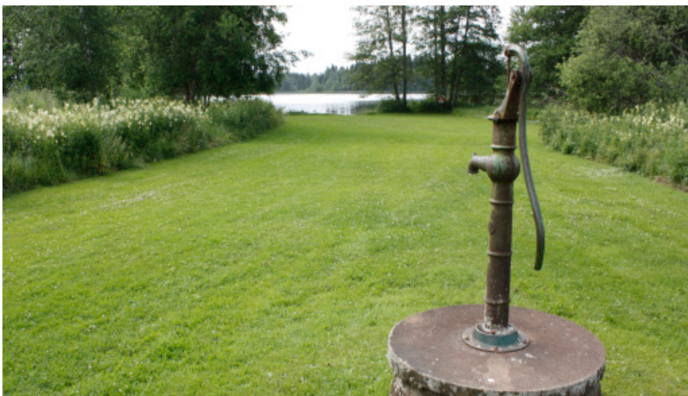
2. Västra badet