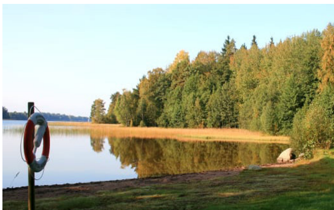
1. Östra badet