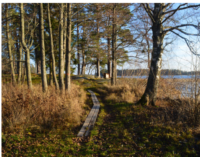
Spång ut till grillplatsen