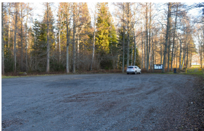
Stora parkeringen vid östra badet

Parkeringen är mycket stor med två olika delar. Det finns en informationsskylt med karta över området. Underlaget är jämnt och på hårdpackat grus.