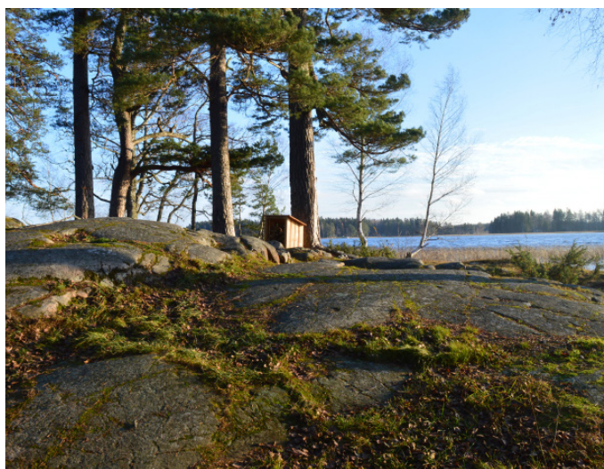
Stenhällarna bredvid grillplatsen