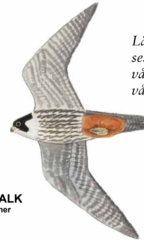
LÄRFALK III. M. Holmer

Lärfalkar kan ibland ses jaga insekter över våtmarken under sen vår och sommar.