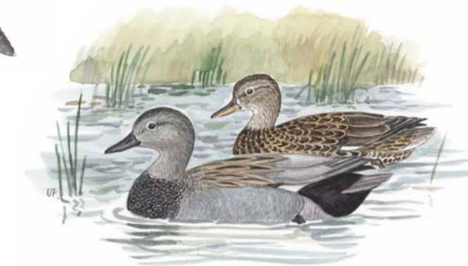
SNATTERAND III. N. Forshed

Snatterand är en simand som rastar och troligen häckar i våtmarken.