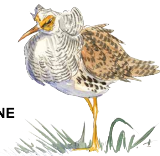
BRUSHANE III. P. Elfman

Snatterand är en simand som rastar och troligen häckar i våtmarken.