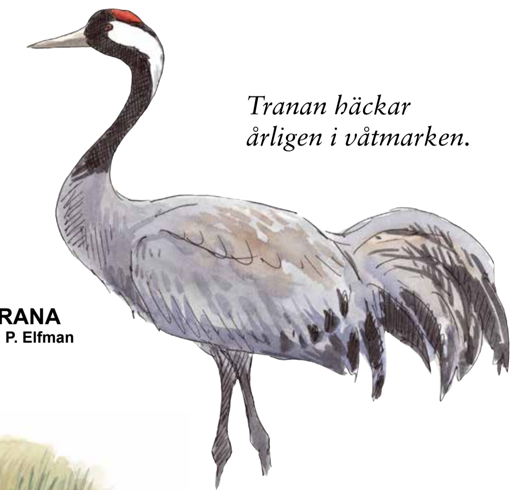
TRANA III. P. Elfman

Lärfalkar kan ibland ses jaga insekter över våtmarken under sen vår och sommar.