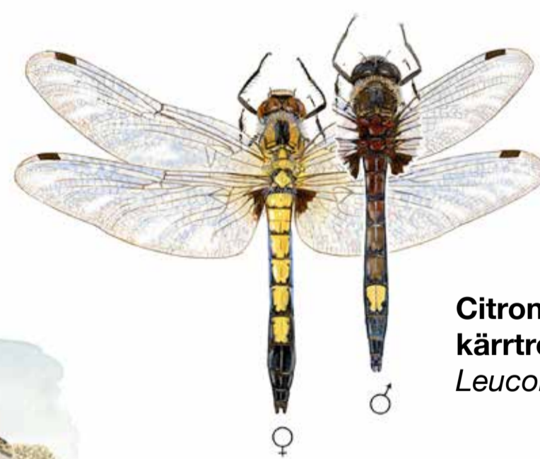
Citronfläckad kärrtrollslända Leucorrhinia pectoralis

Delar av reservatet är klassat som ett Natura 2000 område, området "Brosjön". Natura 2000 är EU:s nätverk för bevarandet av värdefull natur. En av anledningarna till att området anses skyddsvärt är att det är hemvist åt fisken nissöga och den citronfläckade kärrtrollsländan.