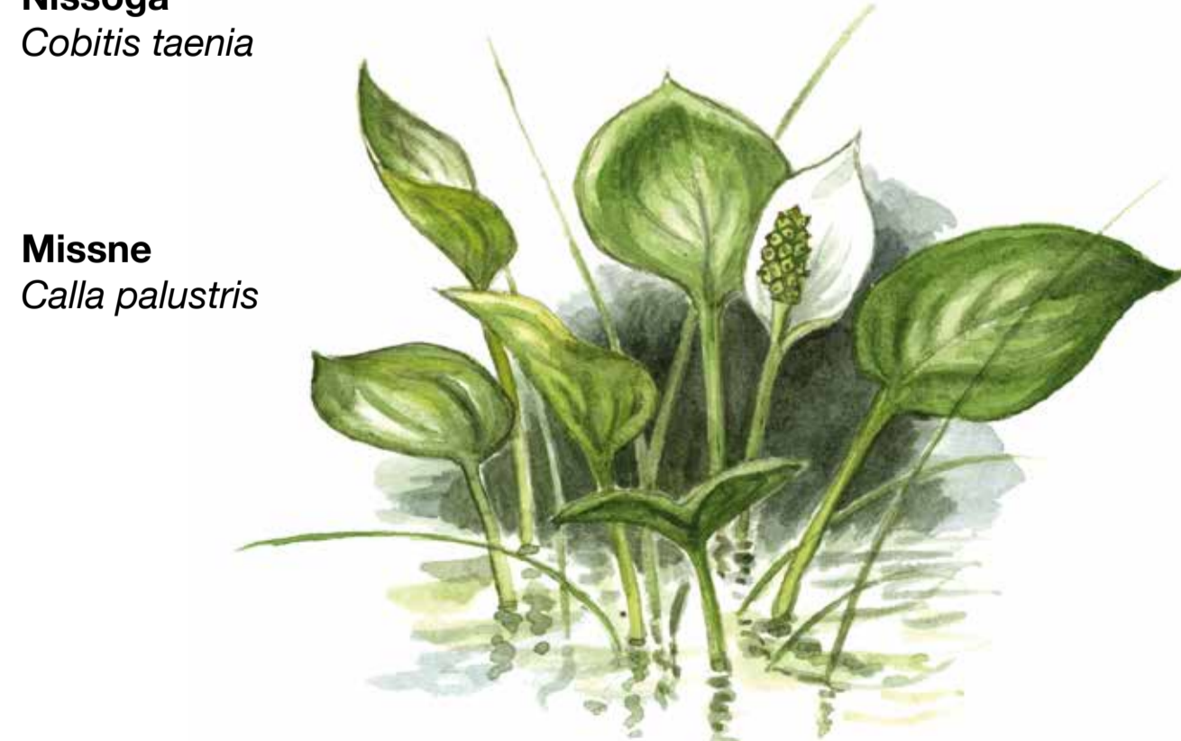
Missne Calla palustris

slingan som bjuder på mer kuperad terräng och som tar dig över hållmarkerna i väster. I öster vid Lavretsvägens ände finner du en vandrings slinga på 1,5 km runt ett tidigare översvämmat område som fått skogen att dö. Detta har blivit en fin lokal för en mängd insekter och fåglar. I reservatets västra del finns även ridleder.