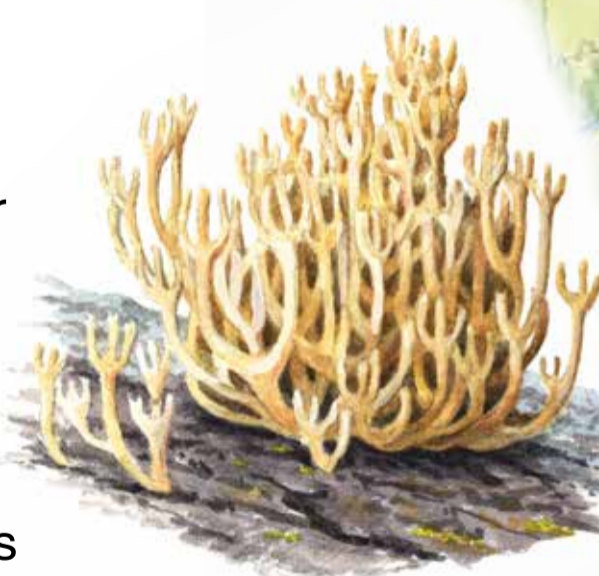
Kandelabersvamp Artomyces pyxidatus

Spetsfläckad trollslända är en av reservatets många sällsynta invånare. Den trivs vid rena, långsamt rinnande vattendrag. Hanens bakkropp är blåpudrad medan honans är rostbrun till brunfärgad.