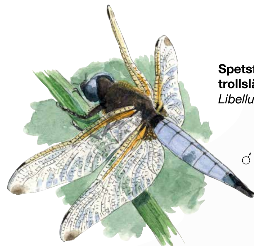
Spetsfläckad trollslända Libellula fulva

Nedströms förenar sig Uringeån med Kagghamraån för vidare färd mot havet. Tack vare havsöringsstammen och de geologiska formationerna är Kagghamraåns nedre åsystem klassat som riksintresse för naturvården.