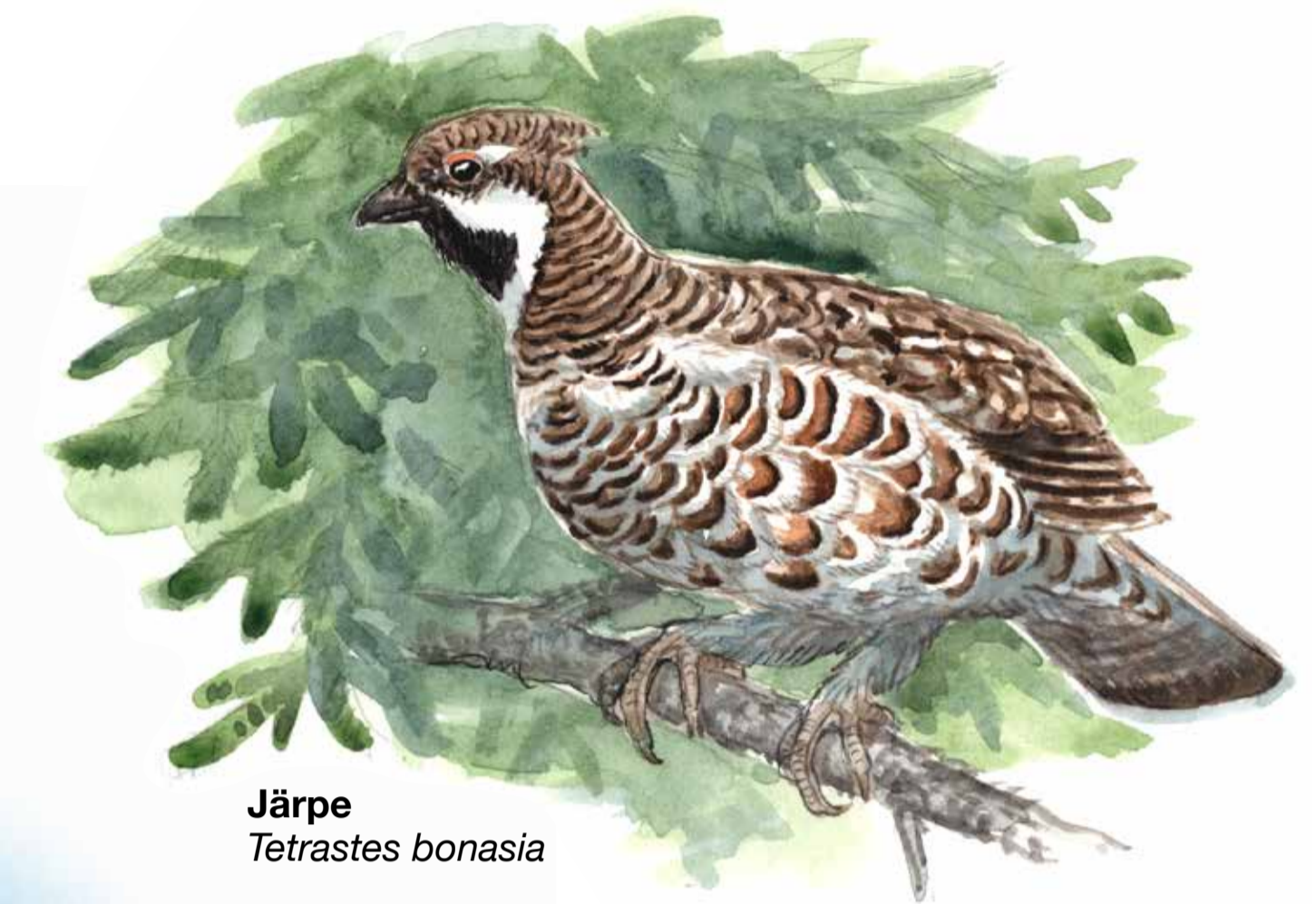
Järpe Tetrastes bonasia

I den fuktiga barrskogen lever järpen, den minsta hönsfågeln i våra svenska skogar. Det är en riktig doldis som smälter väl in i omgivningen. Dess ljusa visslingar går att höra året om.