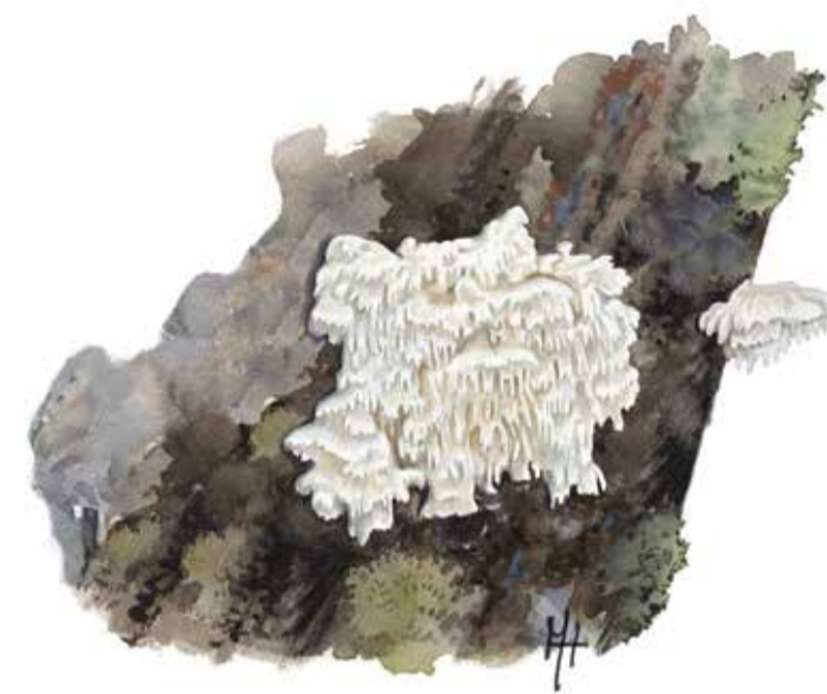
Vintertagging Irpicodon pendulus

Cirka 80 % av reservatets träd är över 90 år gamla. Här finns också träd som är runt 200 år. En del av dessa gamlingar har på ålderns höst rasat omkull och skapat livsmiljöer för mossor, vedsvampar, insekter och fåglar. Den döda veden tillsammans med de gamla träden är nyckeln till en rik mångfald av växter och djur.