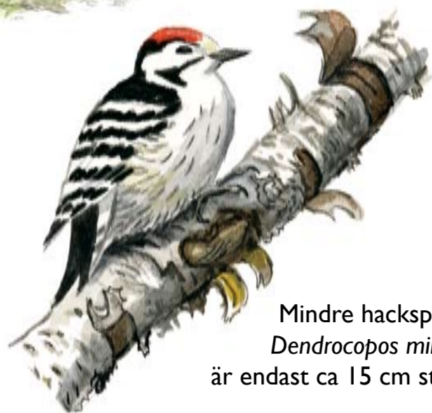
Mindre hackspett Dendrocopos minor är endast ca 15 cm stor.