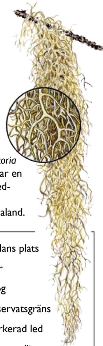
Garnlav Alectoria sarmentosa har en nordlig utbredning och är ovanlig i Götaland.

T rolleflod är ett urskogslikt skogsreservat med ett rikt innehåll av mossor, lavar och svampar. En ca 2 km lång vandringsled går genom den södra delen av reservatet, som totalt är 110 hektar stort och bildades 2002.