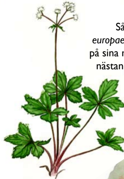
Särsläk Sanicula europaea känns igen på sina mörkt gröna, nästan läderartade, flikiga blad.