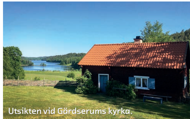
Utsikten vid Gärdserums kyrka.