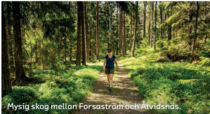
Mysig skog mellan Forsaström och Åtvidsnäs.