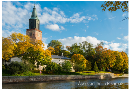
Åbo stad, Seilo Ristimäki